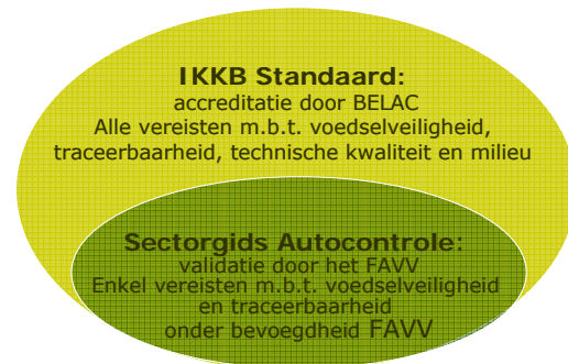
Fig. 3 Relatie tussen de IKKB Standaard en de Sectorgids Autocontrole voor de Primaire Plantaardige Productie.

Het verschil tussen de IKKB Standaard en de Sectorgids Autocontrole voor de Primaire Plantaardige Productie wordt weergegeven in Fig. 3.