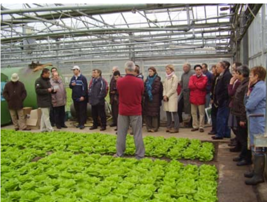
Bezoek op het bedrijf Demyttenaere-Vervenne op 23.11.2006 met DG Agri

In samenwerking met REO Veiling en IKM werd op 23 november 2006 door de Europese leidende ambtenaren van de dienst DG Agriculture and Rural Development een studiedag georganiseerd rond certificatieschema's en autocontrole in de landbouwsector.