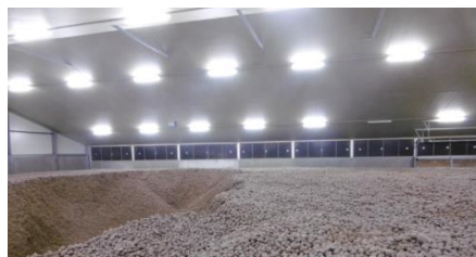
Un hangar de stockage de pommes de terre de l'exploitation Van Puymbrouck. L'exploitation stocke 16.000 à 17.000 tonnes de pommes par an.

« Mon exploitation est certifiée Vegaplan depuis 10 ans. Cette certification offre de nombreux avantages. D'abord, le cahier des charges regroupe les exigences des différents acheteurs. Ensuite, la certification de l'ensemble des cultures donne droit à une réduction sur la contribution annuelle à l'AFSCA, ce qui compense en grande partie les frais d'audits. Quant aux exigences elles-mêmes, elles sont parfaitement réalisables et s'inscrivent tout naturellement dans le cadre d'une bonne gestion d'exploitation ».